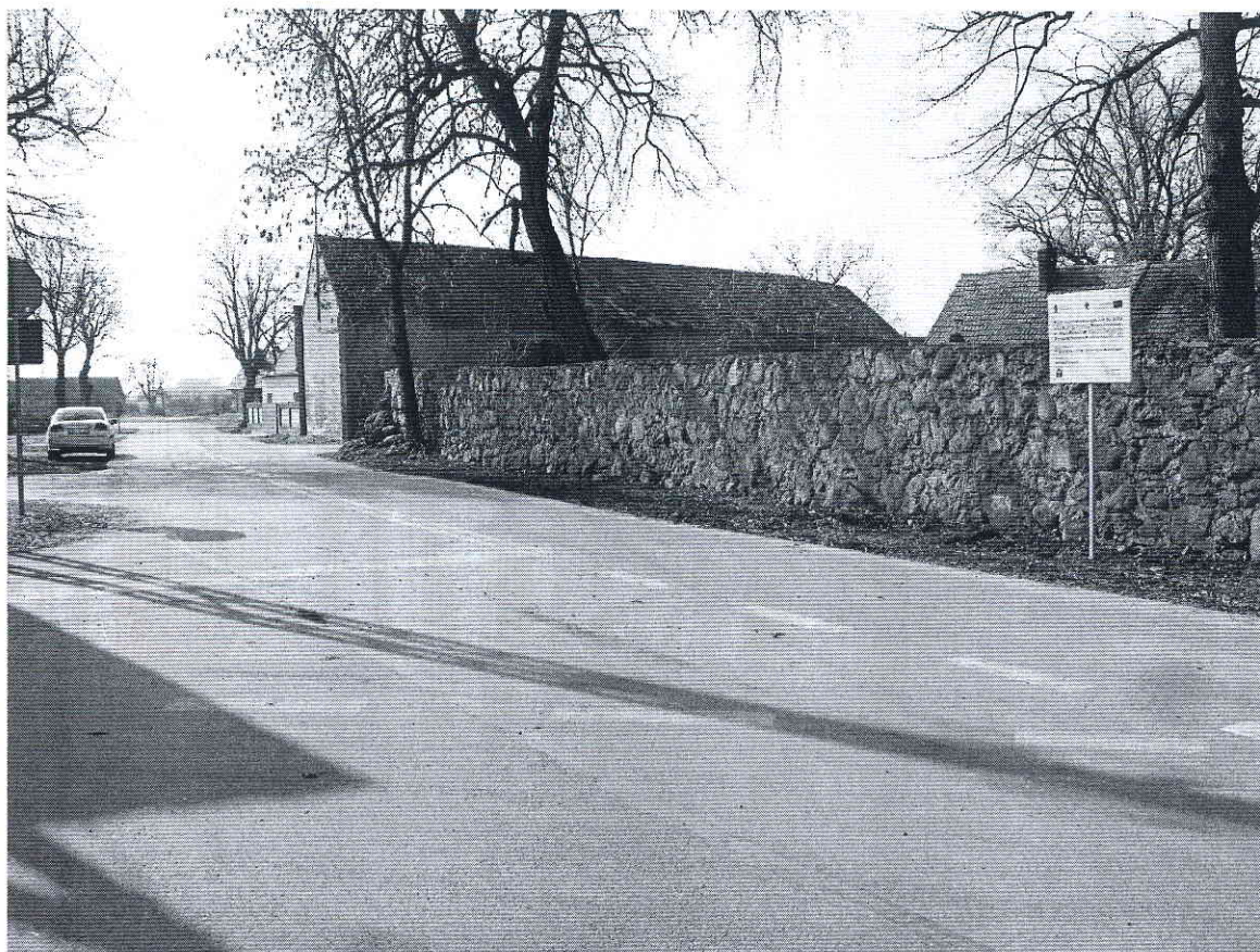
Fot. 3 Tablica w Nieborowie.