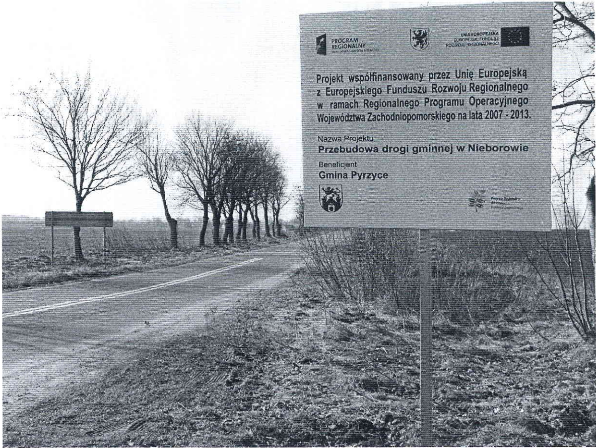
Fot. 1 Tablica przy zjeździe z drogi nr 3