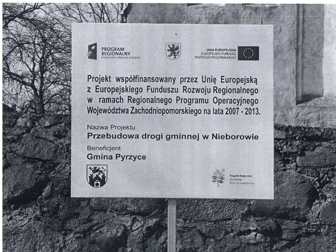
Fot. 4 Tablica w Nieborowie.